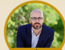
Nacho Álvarez Ex-Secretario de Estado de Derechos Sociales.