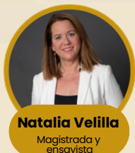
Natalia Velilla Magistrada y ensayista

Desde su experiencia, analizará cómo la autoridad moral, el poder legal y la separación de poderes se combinan para garantizar consensos sólidos y mantener la confianza de la sociedad en las instituciones.