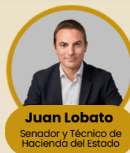
Juan Lobato Senador y Técnico de Hacienda del Estado

Se preguntará qué barreras internas impiden a políticos y partidos a llegar a acuerdos y si es posible superarlas. Y la posibilidad de hacer concesiones para alcanzar consensos.