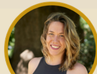
Violeta Serrano Escritora