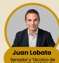
Juan Lobato Senador y Técnico de Hacienda del Estado

Se preguntará qué barreras internas impiden a políticos y partidos a llegar a acuerdos y si es posible superarlas. Y la posibilidad de hacer concesiones para alcanzar consensos.