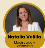
Natalia Velilla Magistrada y ensayista

Desde su experiencia, analizará cómo la autoridad moral, el poder legal y la separación de poderes se combinan para garantizar consensos sólidos y mantener la confianza de la sociedad en las instituciones.